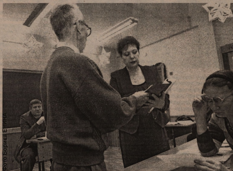
Члены совета территории №10 обсуждают новые тарифы на содержание жилья.

и ремонту внутридомового инженерного оборудования, конструктивных элементов жилых зданий и придомовых территорий, по уборке дворов и лестничных клеток, обслуживанию мусоропроводов и лифтов. И многие горожане не понимают, почему за одну и ту же работу (уборку подъездов, ремонт стен или труб в подвале) могут быть разные тарифы. Они считают, что ставки платы за одинаковые услуги должны устанавливать городская власть, согласно нормативам предоставления услуг по обслуживанию дома. А те работы, стоимость которых не включена в тариф и предоставляются по желанию или просьбам жильцов дополнительно, и должны оплачиваться ими сверх утвержденных расчетов. Иначе управляющие компании «включат в тариф любые свои прихоти, зарплаты и корпоративы. И это будет грабёж жильцов».