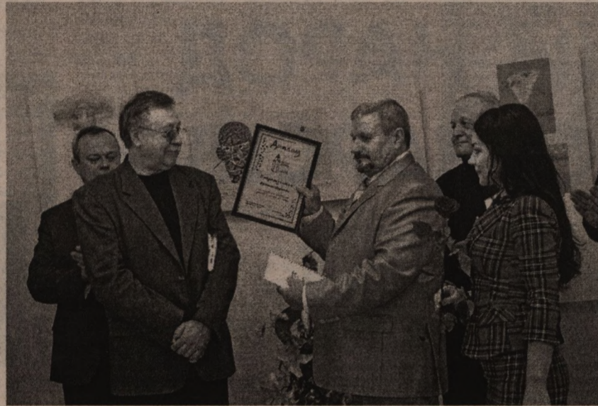
Награды – победителям

1 ноября в выставочном зале детской художественной школы состоялась церемония награждения победителей конкурсов карикатуры и детского рисунка, прошедших в рамках международного фестиваля «Чистый взгляд – 2010».