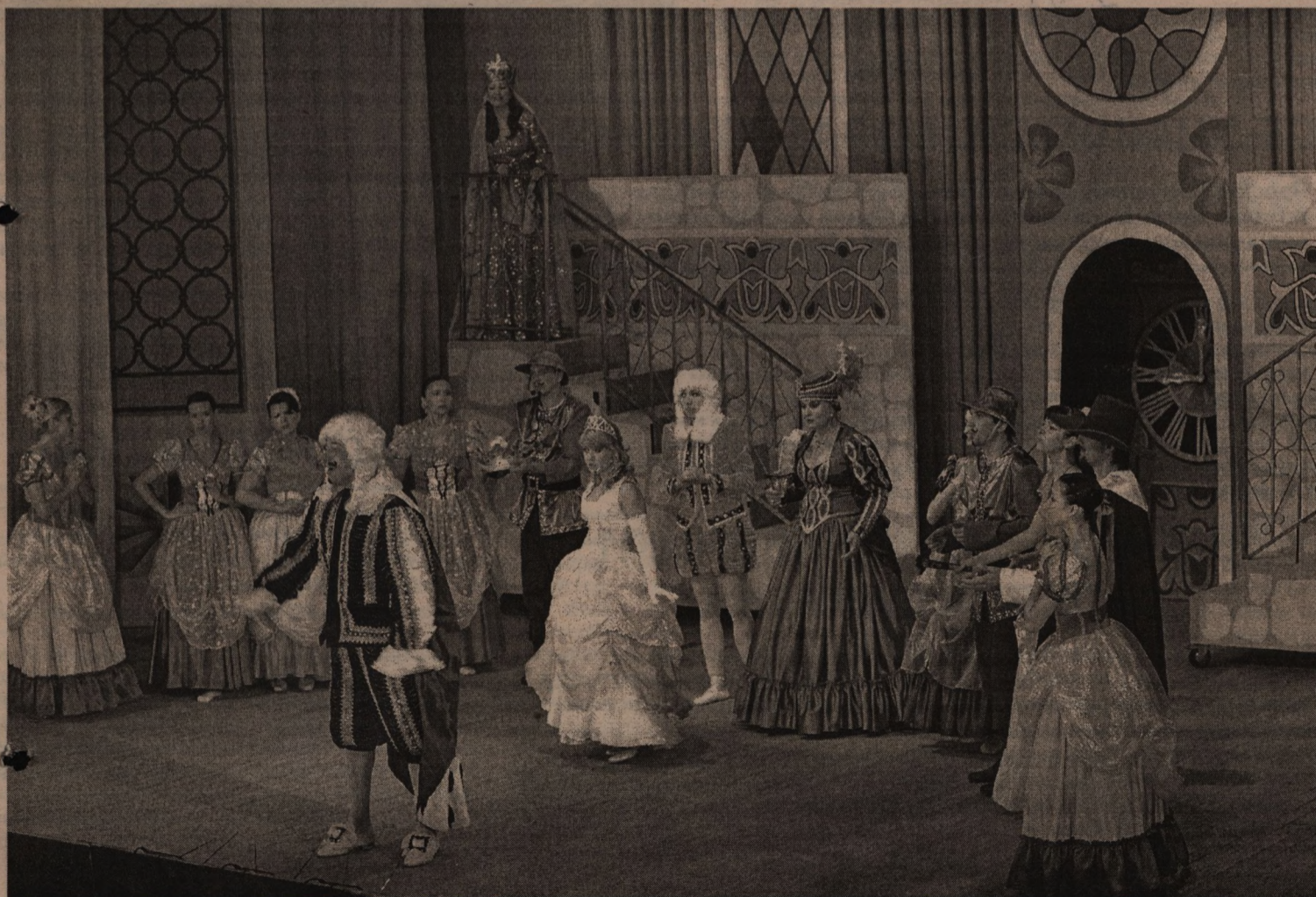
«Золушка» покорила юных зрителей