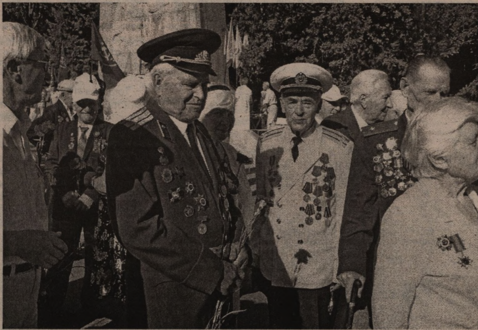
Для ветеранов, освобождавших одну землю, нет границ - она для них священна.

Белгородцы поздравили соседей с Днём города