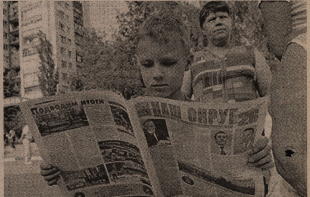
Праздничные газеты Советов территорий интересны всем жителям независимо от возраста.