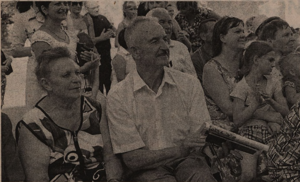
На территориях проходили концерты. Среди зрителей был и депутат Белгородской областной Думы Юрий Селиванов.