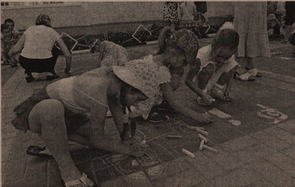
Конкурс детского рисунка на асфальте посвящен любимому городу - светлому и уютному общему дому.