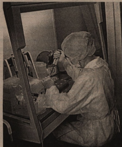
методы генно-модулярных и химико-токсикологических исследований.

В БелМВЛ 15 отделов, в них работают 205 специалистов: ветеринарные врачи-бактериологи, вирусологи, диагностики, ихтиопатологи, а также химики-радиологи, метрологи, агрономы-семеноводы. Высокопрофессиональные кадры и новейшее оборудование, которым укомплектована лаборатория, позволяют вести обширную работу по диагностике и профилактике болезней животных и обеспечению безопасности и качества сельскохозяйственной продукции. Наряду с классическими в лабораторную практику внедряются высокоточные