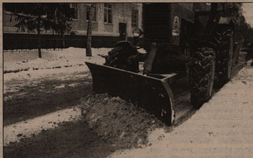
На снимках: Погрузка обычного автомобиля марки «жигули» в кузов эвакуатора занимает от силы — пять минут. Расчистка участка дороги трактором: начисто дорожное покрытие подметет специальная щетка, работающая сзади трактора.

были вывешены специальные знаки, оповещающие о грядущей уборке, под «дворники» припаркованных автомобилей были прикреплены листочки с объявлением, в котором автомобили-