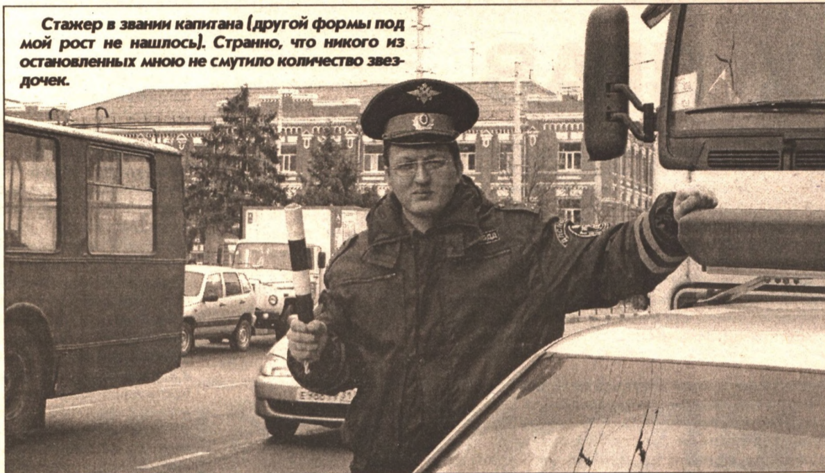
Стажер в звании капитана (другой формы под мой рост не нашлось). Странно, что никого из остановленных мною не смутило количество звездочек.

недавно подожгли хулиганы, а сделать надпись краской на них вообще считает долгом каждый.