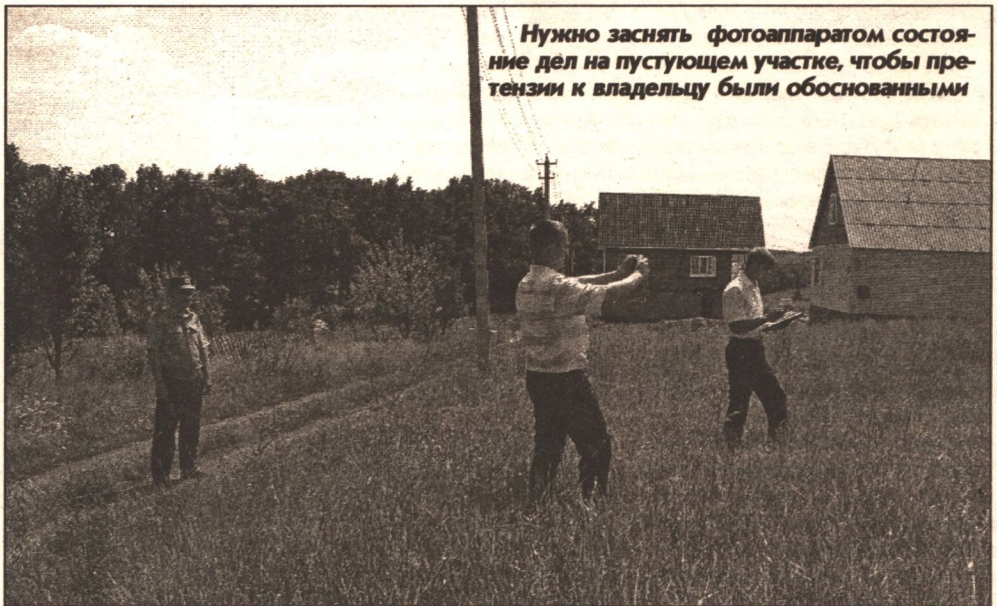
Нужно заснять фотоаппаратом состояние дел на пустующем участке, чтобы претензии к владельцу были обоснованными

но на генплане...», - уверен Валентин. Ищут пропавших почти что без вести соседей Валентина по самым разным каналам. По дан-