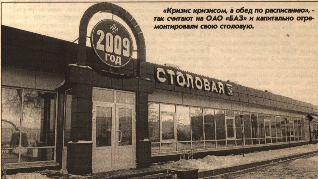
«Кризис кризисом, а обед по расписанию», - так считают на ОАО «БАЗ» и капитально отремонтировали свою столовую.