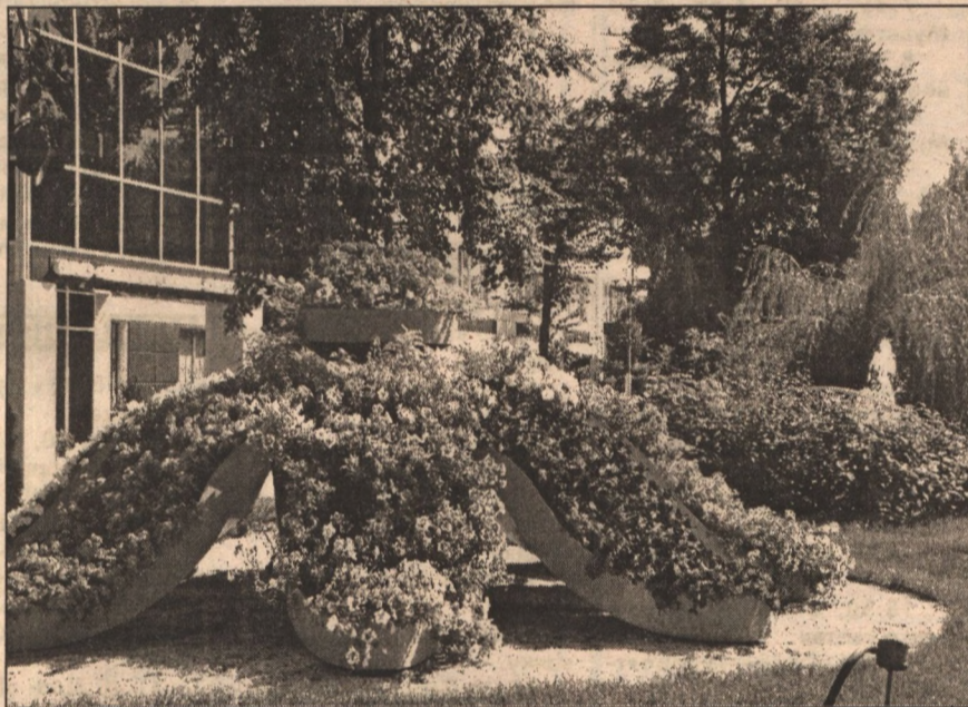
Цветники, клумбы, фонтан превратили прилегающую к заводу «Белгормашсервис» территорию в настоящее место отдыха. Посидеть на скамеечке, сфотографироваться сюда приходят жители окрестных домов.

За каждым предприятием, в соответствии с договорами с комитетами по управлению округами города, закреплены санитарно-защитные зоны. И предприниматели должны содержать их в чистоте, регулярно озеленять. Некоторые воспринимают это не как обязанность, а как удовольствие и вкладывают в благоустройство всю душу. Создают настоящие архитектурно-ландшафтные комплексы с интересными и даже уникальными элементами. Та-