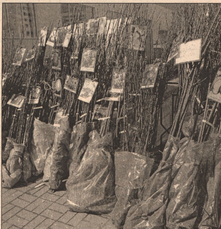
Сорняки уже вылезли.

9 мая - Водолей - бесплодный знак. Полезно прополоть почву.