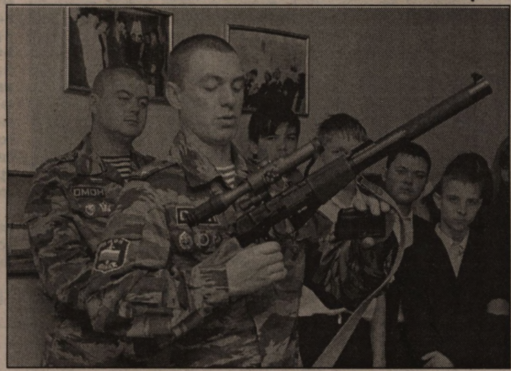
На снимке: во время демонстрации боевого оружия.