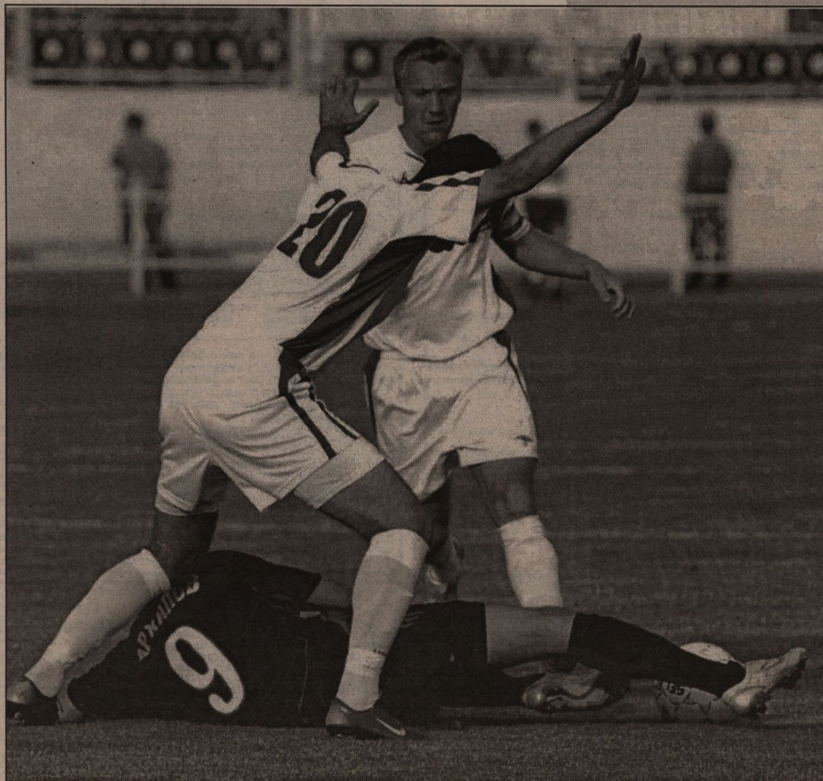
Материалы подготовил Александр ВОЛОВИЧЕВ, член клуба «Салют-Энергия»

«Динамо» Воронеж - «Локомотив» Лиски - 0-1 «Елец» Елец - «Губкин» Губкин - 2-0 «Сатурн» Егорьевск - «Спартак» Тамбов - 0-1 «Ника» Москва - «Металлург» Липецк - 0-2 «Локомотив» Калуга - «Спартак-МЖК» Рязань - 1-2 «Звезда» Серпухов - «Дон» Новомосковск - 1-1 «Рязань-Агрокомплект» Рязань - «Зенит» Пенза - 1-2 «Спартак» Луховицы - «Мордовия» Саранск - 1-1