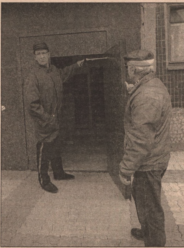
общие сняли и увезли неведомо куда. И вот уже более двух недель в подъезде - «день открытых дверей». Кстати, ночей тоже.

Железные двери с домофонами, которые жильцы покупали, кстати, за свои деньги, вместо того, чтобы выше поднять в связи с укладкой тротуарной плитки, просто-напросто снизу обрезали на 20 см. А в шестом подъезде, в котором живут мои собеседники, дверь эту изуродованную во-