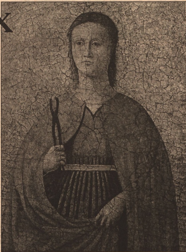
личество!), которые хотят получить благословение святой на свою будущую профессиональную деятельность.

Кстати, в Румынии существует единственный в мире университет Святой Аполлонии, специализирующийся на подготовке стоматологов. Там ежегодно обучаются 148 мужчин и 187 женщин (не знаю уж, почему именно такое ко-