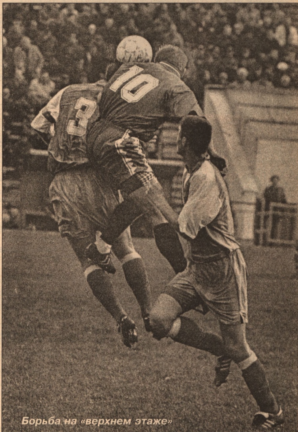
Борьба на «верхнем этаже»

Наиболее интересным и зрелищным матчем в игровом плане с участием команды