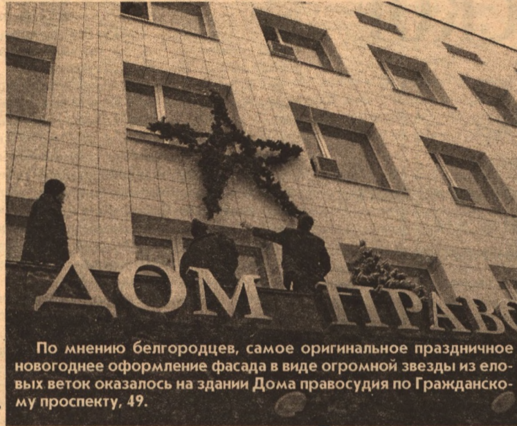
По мнению белгородцев, самое оригинальное праздничное оформление фасада в виде огромной звезды из еловых веток оказалось на здании Дома правосудия по Гражданскому проспекту, 49.