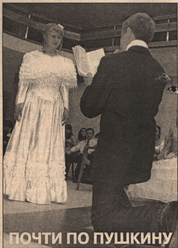
ПОЧТИ ПО ПУШКИНУ

Украшением состоявшегося на минувшей неделе во Дворце культуры «Энергомаш» первого Пушкинского бала стала не только пара, выигравшая конкурс чтецов, но и танцы, наряды, манеры XIX века, которые демонстрировали старшеклассники гимназии № 3.