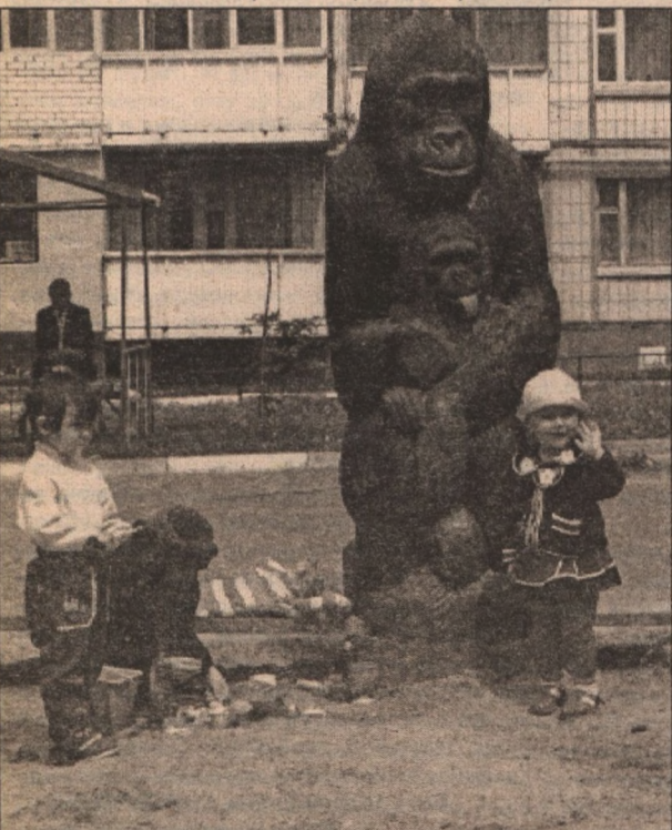
Звери из джунглей - наши друзья!