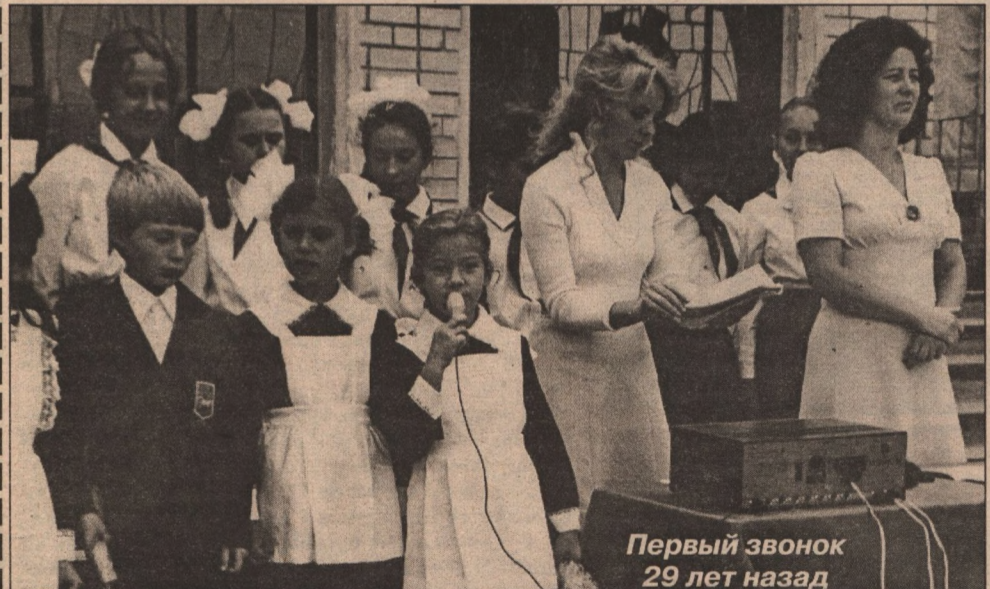
Первый звонок 29 лет назад

- В юности частенько посещала влюбленность - чувство, свойственное молодым. Оно приятное, но быстро проходящее. А любовь - это праздник души, это нечто огромное и сильное. Любовь - полная гармония чувств. И я рада, что это чувство не обошло меня стороной. Наша любовь с мужем проверена временем. Но и до вступления в брак мы долго дружили. Я работала в Шебекино, а он учился в Харькове, но каждый выходной приезжал пови-