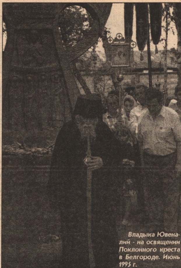
Владыка Ювеналий - на освящении Поклонного креста в Белгороде. Июнь 1995 г.

Многие сюжеты — это эпизоды повседневной жизни персонажей, мгновения их радостей и забот. К