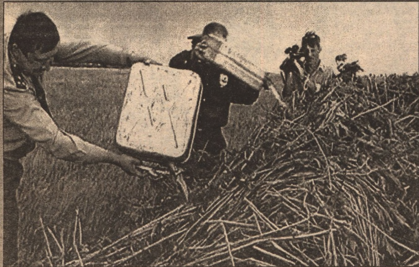
го училища №28 и антинаркотическая комиссия администрации города. Всю коноплю вырвали с корнем, сложили в огромный стог, облили бензином и подожгли. Теперь во избежание повторного произрастания эта территория будет

Недавно при проведении операции «Мак - 2003» в Валуйках, рядом с отстойником ОАО «Валуйки - сахар», на площади около четырех гектаров была обнаружена дикорастущая конопля. Для ее уничтожения, которое длилось двое суток, были привлечены местные жители, а также учащиеся профессионально-