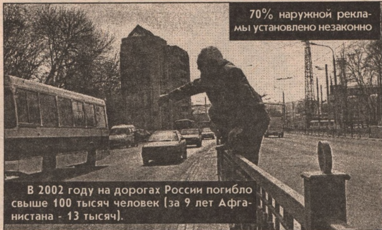
70% наружной рекламы установлено незаконно

тральной улицы Щорса на второстепенную улочку им. Апанасенко - живущие там водители пикеты возле администрации начнут устраивать. А вот то, что утром закрытый левый ряд одной из самых напряженных улиц города частень-