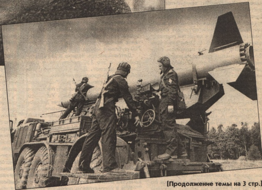
(Продолжение темы на 3 стр.)