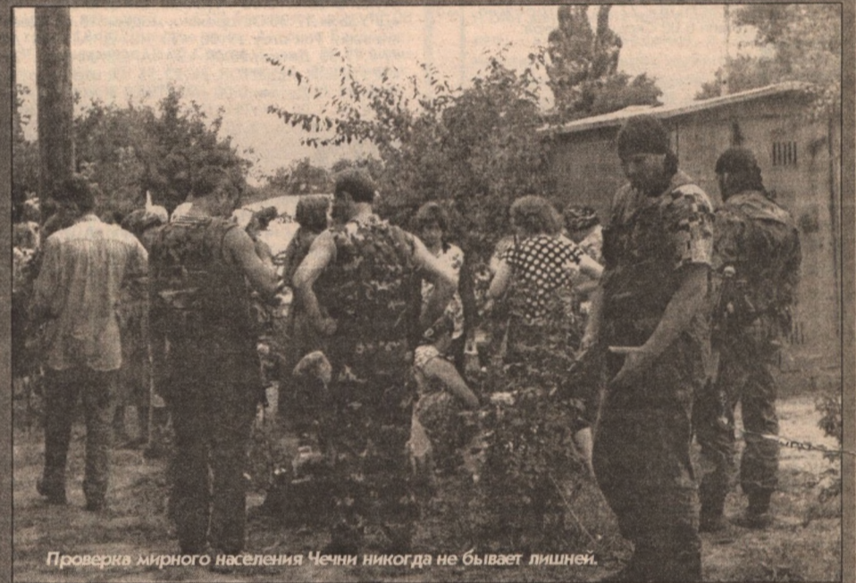
Проверка мирного населения Чечни никогда не бывает лишней.

Вот с этой позиции и будем смотреть. Нравится нам это или нет.