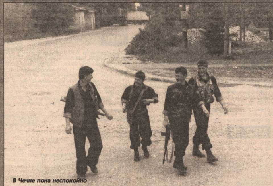
В Чечне пока неспокойно

язык». Писатель говорил о том, что максимально хотел избежать «чернухи», нагнетания ужасов. Но ему звонили читатели и говорили, что страшно переворачивать страницу: в каждой строчке – трагедия. Читать, и то страшно, а пережить такое? А