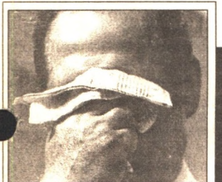
ОЧЕНЬ ВЫРОС В ЭТОМ МИРЕ ВИРУС ГРИППА... - 12 стр.