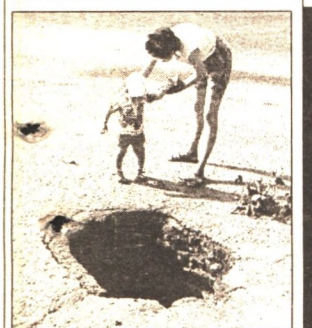
ЖКХ: «ЧЕРНАЯ ДЫРА» - 6 стр.