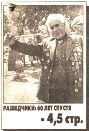
РАЗВЕДЧИКИ: 60 ЛЕТ СПУСТЯ - 4,5 стр.