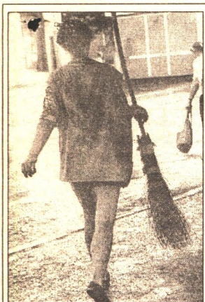
В КОНСТИТУЦИИ ОДНО, А «В ПРИРОДЕ» - ДРУГОЕ