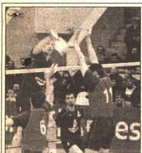
НЕПОБЕДИМЫЙ «ЛОКОМОТИВ» ОДЕРЖИВАЕТ 12-Ю ПОБЕДУ