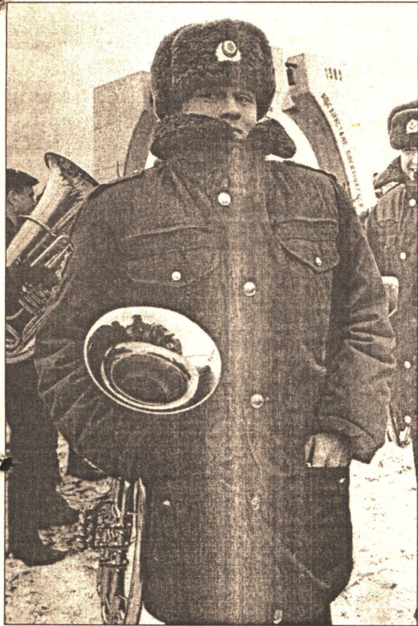
Дама - с трубой, или праздничный настрой