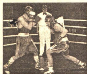
НЕ БЕЙ, ВАНЯ, НИЖЕ ПОЯСА - 4 стр.