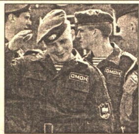
МОЯ И ТВОЯ МИЛИЦИЯ НАС БЕРЕЖЕТ! - 13 стр.