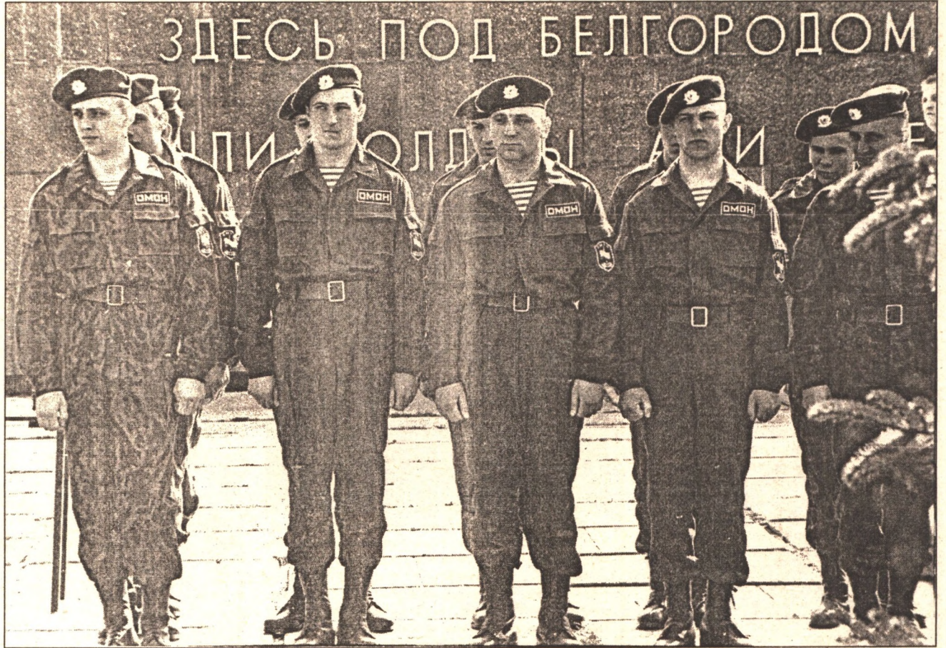
Милиционеры - парни brave!