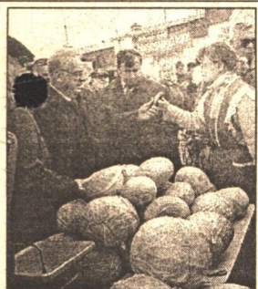
ЭКОНОМИКА: ВОТ ТАК И ЖИВЕМ