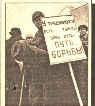
ПРОФСОЮЗЫ БОРЮТСЯ ЗА ДОСТОЙНУЮ ЗАРПЛАТУ - 3 стр.