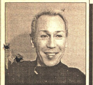
ИТАК: ПЕСКОВ ПАРОДИСТ ИЛИ ПАРОДИСТ? - 15 стр.