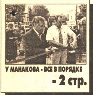
У МАНАКОВА - ВСЕ В ПОРЯДКЕ - 2 стр.