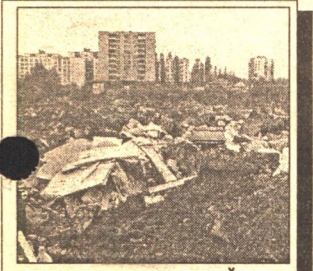
ОН СКАЗАЛ: «ВЫВАЛИВАЙ!» - И МАХНУЛ РУКОЙ... - 6 стр.