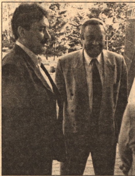
картину Вадима Абдрашитова «Время танцора», повествующую о событиях на Кавказе. Фильм берет за душу тех, кому пришлось пережить горечь расставания с родными местами, и тех, кого миновала эта участь. Война - не выход. Как научиться жить вместе на одной земле? Об этом заставляет задуматься картина.

В программу фестиваля вошли лучшие художественные и документальные фильмы последних лет о судьбах беженцев и вынужденных переселенцев. На одном дыхании зал смотрел