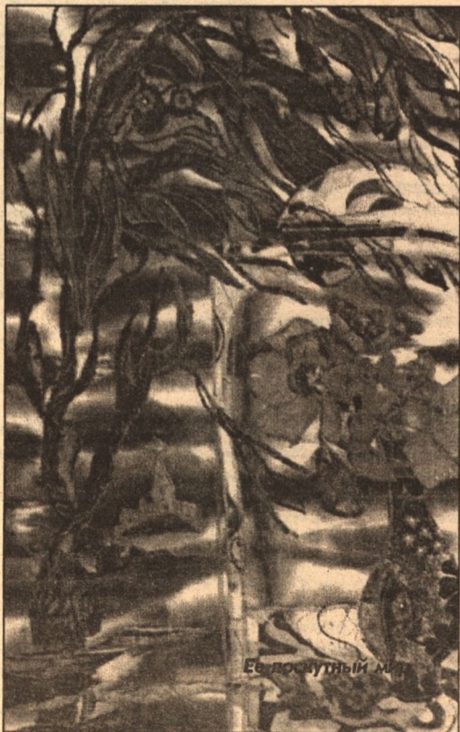
Её лоскутный мир

они мне, - говорит Кудрявцева. - Мужество этих детей заставляет иначе видеть мир, пересмотреть отношение к своим проблемам и труд-