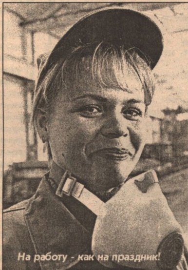
На работу - как на праздник!