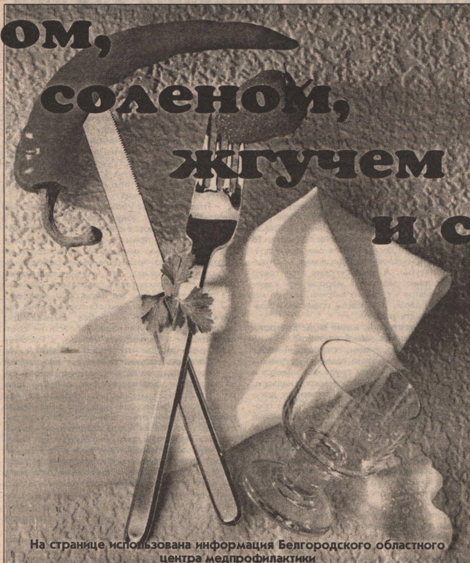
На странице использована информация Белгородского областного центра медпрофилактики

Вяжущие, горькие и сладкие средства влияют на общее биологическое «равновесие» организма и кровяную систему. Жгучие, кислые и соленые - на эндокринную и обмен веществ. Сладкие вообще рекомендуются для пожилых людей