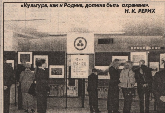
«Культура, как и Родина, должна быть охранена». Н. К. РЕРИХ

В библиотеке тогда собралось немало горожан, среди которых был и цвет городской интеллигенции - художники, архитекторы, музыканты, преподаватели школ и представители науки. А в Москве, как раз незадолго до этого, прошла первая общероссийская конференция МЦР (Международного центра Рерихов), собравшая под свое крыло всех изучающих духовное наследие знаменитой русской семьи культурных деятелей, исследователей и путешественников. Таким образом, еще одно «окно» духовности, искусства, связи с колыбелью знания Индии и Тибета было открыто навстречу.