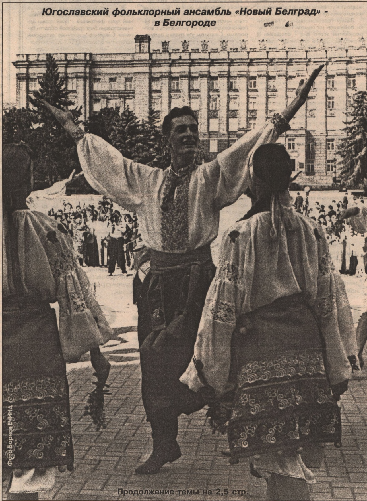
Продолжение темы на 2,5 стр.

Югославский фольклорный ансамбль «Новый Белград» - в Белгороде