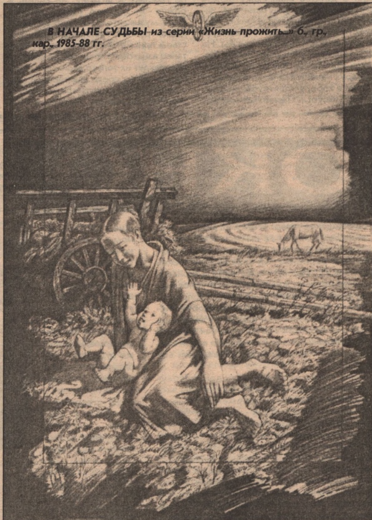
В НАЧАЛЕ СУДЬБЫ - из серии «Жизнь прожить...» б. гр., кар., 1985-88 гг.

Сквозь жизнь веселую мою Просвечивает жизнь другая: Там мы с тобою сберегаем Не выдавшийся здесь уют; И пташки вольные поют, И мы бредем над берегами В навроном августе, не вспомню - Сквозь жизнь веселую мою - Бесплатный, гаснущий, неполный