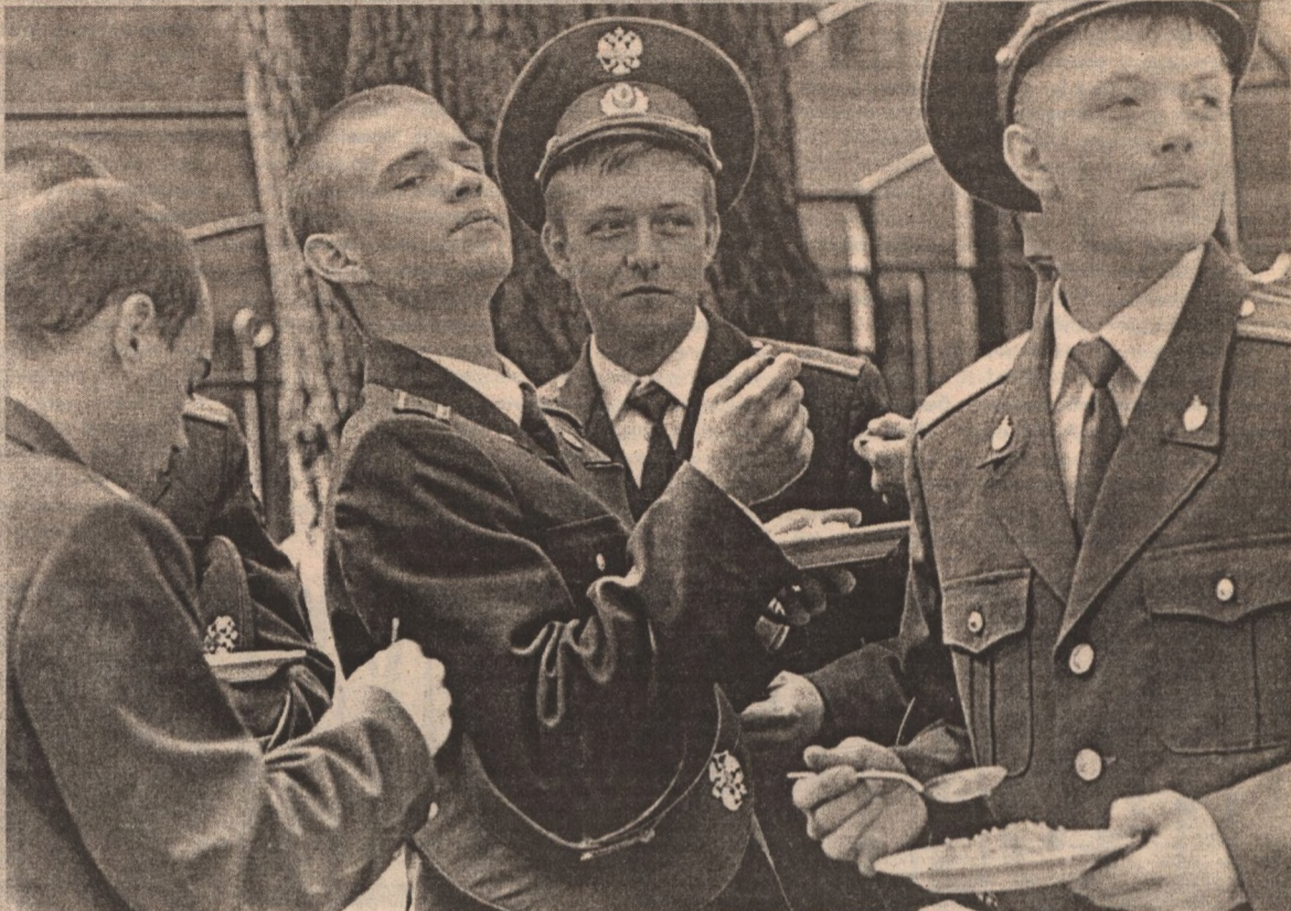
Им предстоит есть не только «солдатскую кашу», но и защищать Родину!