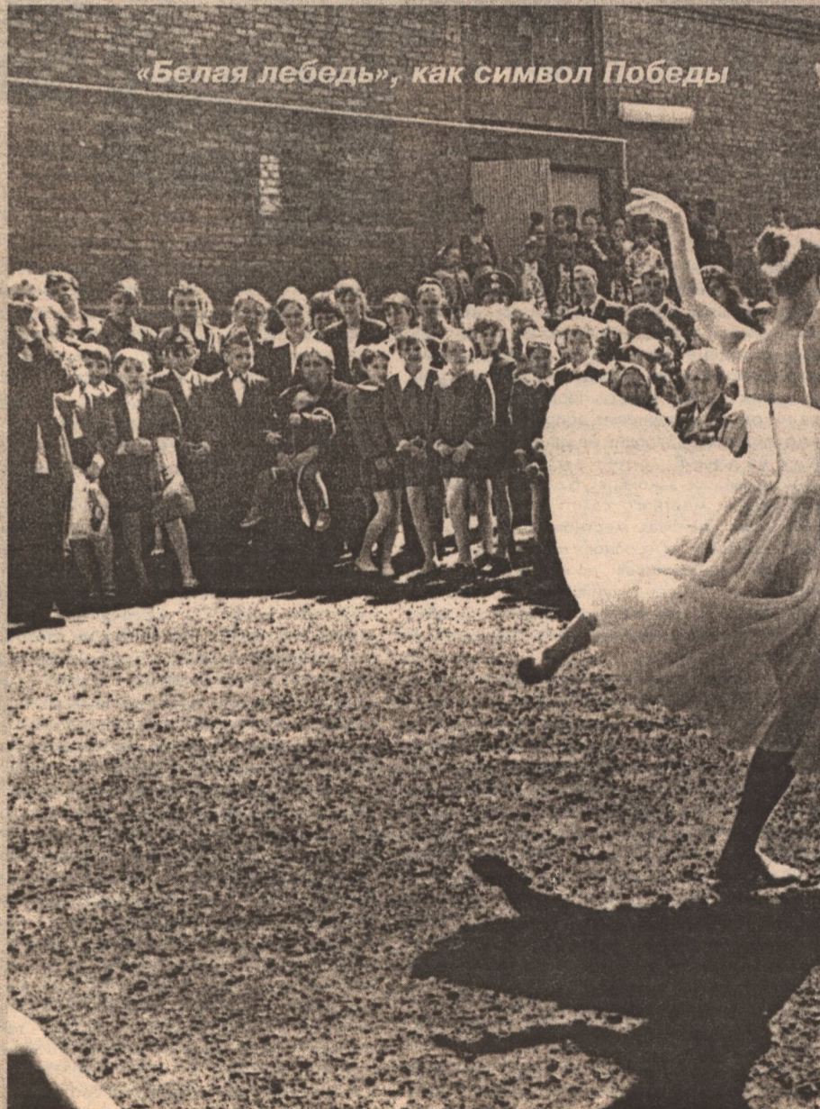
«Белая лебедь», как символ Победы