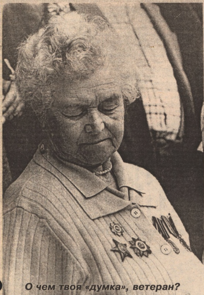
О чем твоя «думка», ветеран?