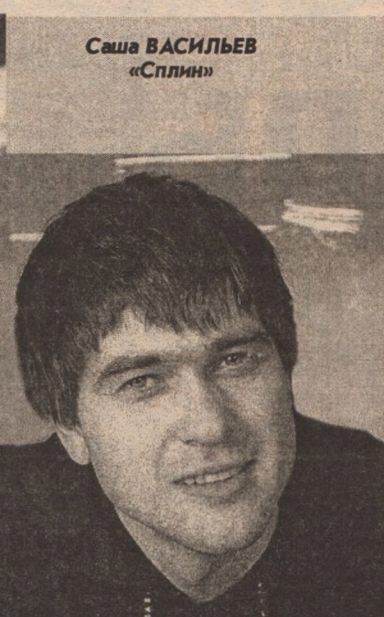
Саша ВАСИЛЬЕВ «Сплин»