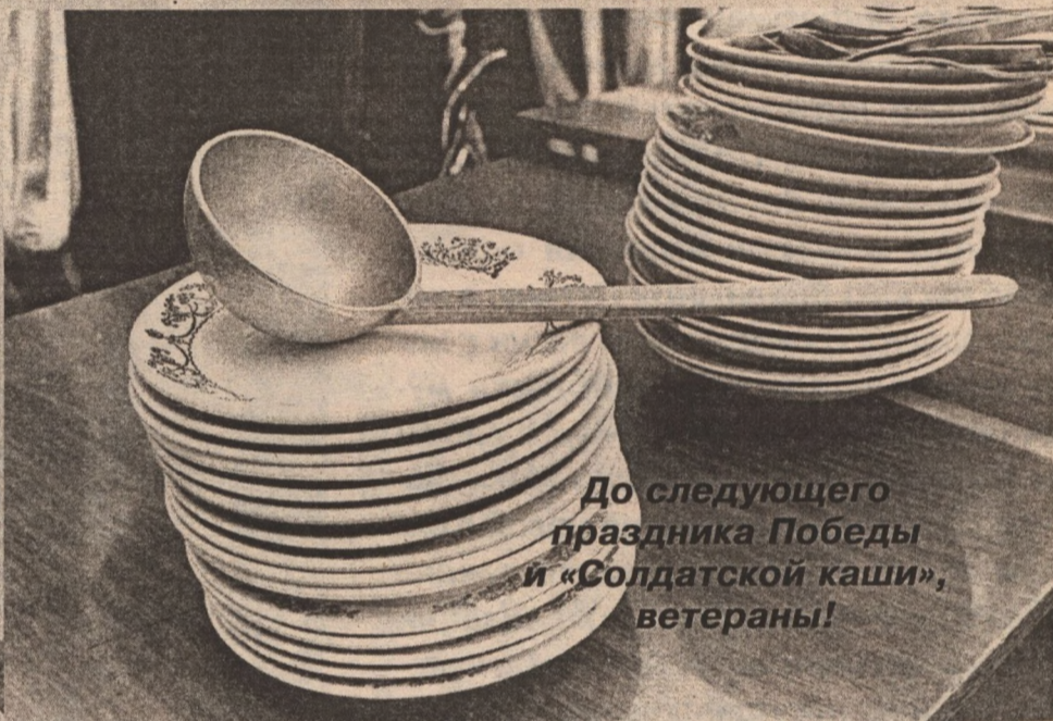
До следующего праздника Победы и «Солдатской каши», ветераны!