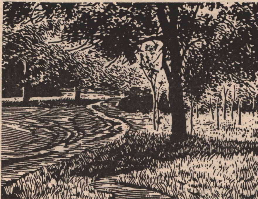
Рисунки Дмитрия МАМАТОВА

Зарос мой двор травой до самых окон. Зеленый гимн колышется стеной И ковыля-пришельца сизый локоп Звенит своей мелодией степной. Венчает храм природы птичье пенье, Здесь воздух чист, как в сказочном бору, На это чудо вечного творенья Смотрю и косу в руки не беру. Я содрогнусь, когда цветы очнутся, Как отзвук жизни светлый и живой, В последний раз испуганно качнутся И упадут к рассвету головой. Запахнет сеном скошенным и летом, Завянет лик чарующей красы И станет очень грустно мне при этом Победном звоне дедовской косы. Но вот заря купается в затоне, Волшебный мир у смерти на краю, Иду на приступ и плюю в ладони, Как будто в душу грешную свою.