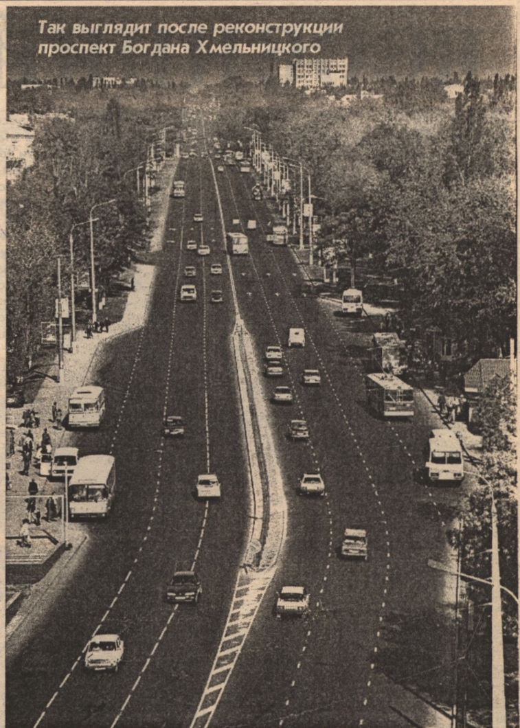
Так выглядит после реконструкции проспект Богдана Хмельницкого

В 2000 году администрацией рассмотрено 7788 письменных обращений белгородцев.