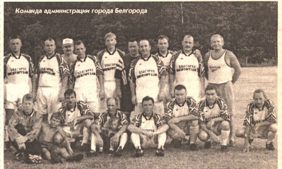
Команда администрации города Белгорода