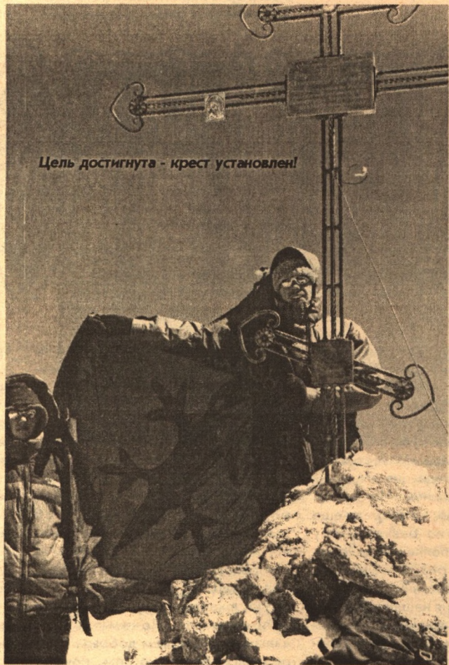
Цель достигнута - крест установлен!

- Это проверенные люди, на которых можно положить