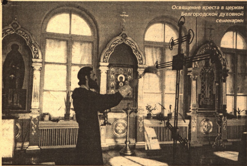
Освящение креста в церкви Белгородской духовной семинарии

горы непросто, и лишний груз будет обузой.