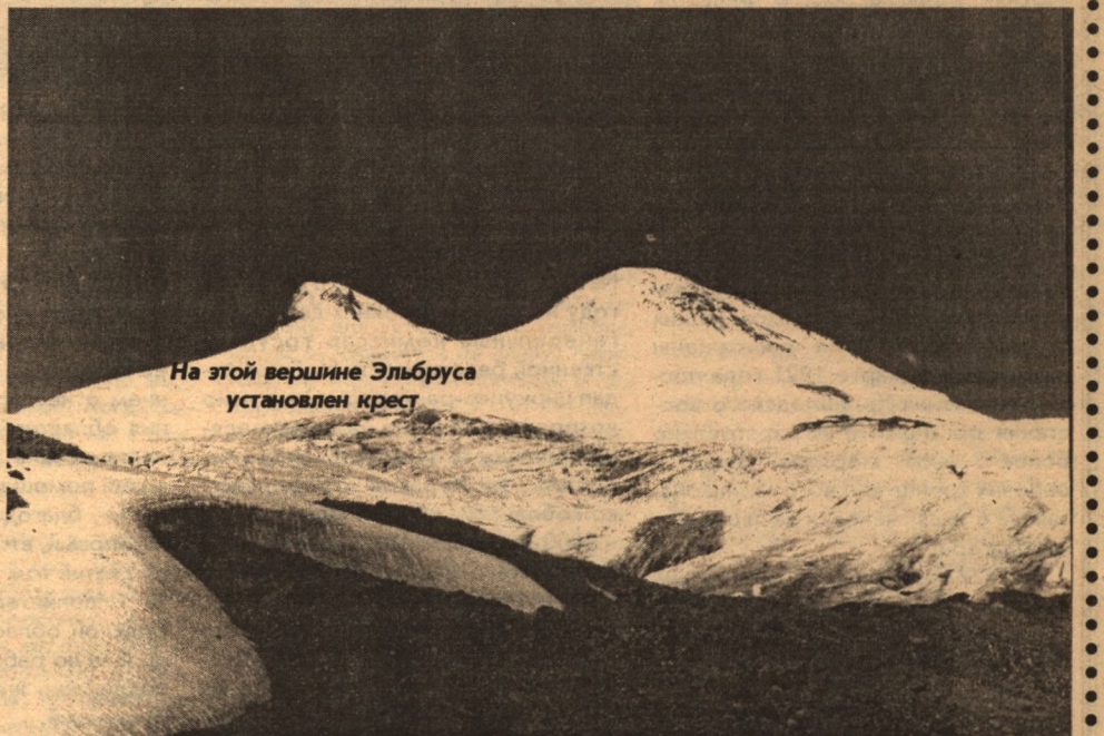
На этой вершине Эльбруса установлен крест

Казалось бы, взята самая высокая планка. Но не таковы душа и сердце тех, кто связал свою жизнь с горами, чтобы останавливаться на достигнутом. Постоянная неуспокоенность, никакой остановки - вот их жизненный принцип. Не так давно, в начале октября, команда белгородских туристов вернулась со всероссийских соревнований по горным видам спорта.