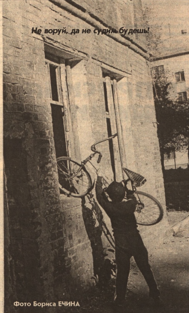
Не воруй, да не судим будешь!

У автомобильных воров традиционно особой популярностью пользуются автомагнитолы. Оно и понятно: эта дорогостоящая вещь в автомобиле относительно доступна, особенно если он стоит на улице. Стоит только выбить стекло или взломать замок - и вождельный предмет в руках. Однако далеко не всегда ворам удается воспользоваться добычей. Ночью 31