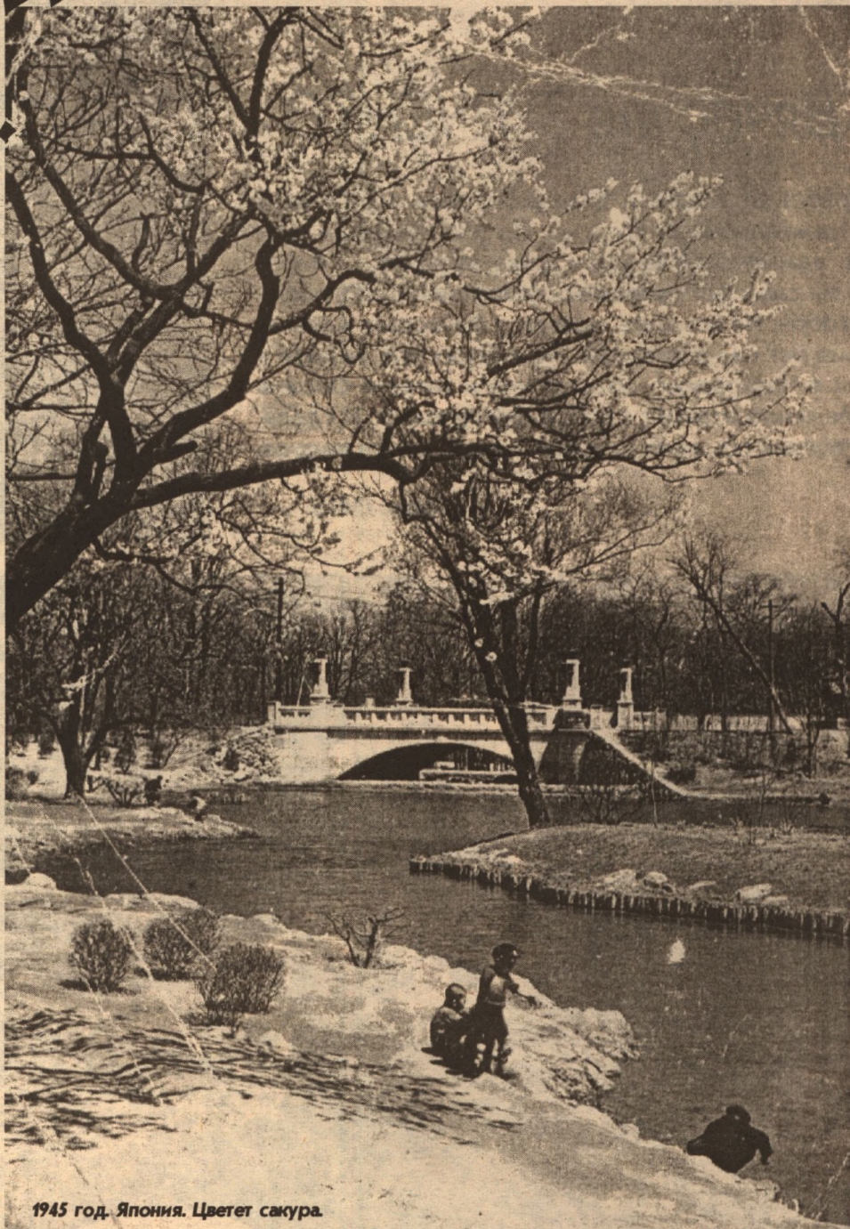
1945 год. Япония. Цветет сакура.