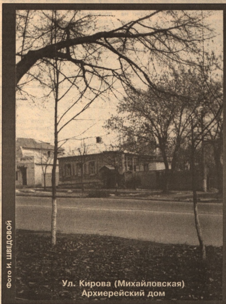
Ул. Кирова (Михайловская) Архиерейский дом

Почти век в XX столетии простоял на этой улице один дом с небывало интересной историей. Его знали, знают и помнят в Белгороде многие жители. Помнят не из-за исторических или же каких-либо судьбоносных событий, а из-за его одной характерной детали, чисто декоративного свойства. На фронтоне этого дома была увековечена цифра 1888. Это дата его постройки. Дом был построен из кирпича, с верандой, на полутора уровнях.