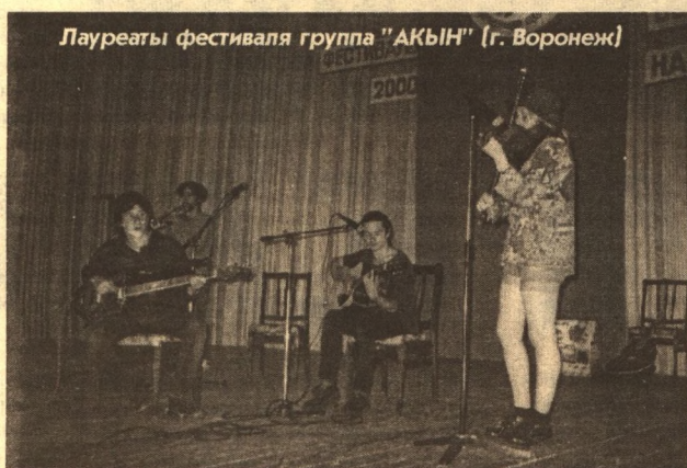
Лауреаты фестиваля группа «АКЫН» (г. Воронеж)