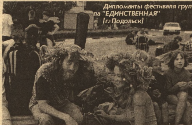
Дипломанты фестиваля группа «ЕДИНСТВЕННАЯ» (г. Подольск)

Вообще, исполнительское мастерство участников фестиваля за последнее время очень выросло. Что касается тенденций, просматривающихся в творчестве юных рок-музыкантов, то они меня вполне устраивают. Если десять лет назад всё было насквозь пропитано псевдо-патриотизмом, а потом наступил период упадка и пессимизма, когда практически ни одна песня не обходилась без слова «помойка», то теперь, как мне кажется, мы достигли некоей золотой середины. Поэзия стала более разноплановой, появились интересные образы, меньше стало раздражительности.