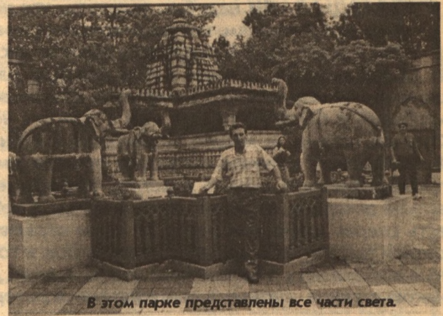
В этом парке представлены все части света.