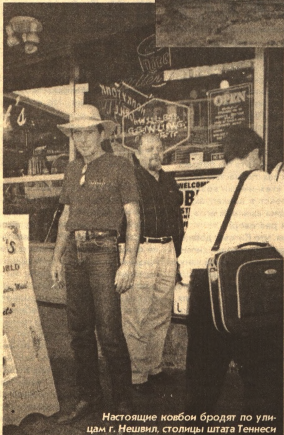
Настоящие ковбои бродят по улицам г. Нешвил, столицы штата Теннесси

помогла. Но, по ее признанию, полтора часа под светом юпитеров и шквалом вопросов от американских граждан выдержать было непросто.