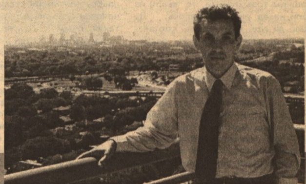
Новый Орлеан расположен на реке Миссисипи