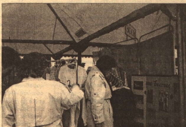
Возрождается трикотажное производство в Старооскольском ООО «Белтекс»

тели непродовольственных товаров. Мебель, стройматериалы, обувь, швейные и трикотажные изделия, предметы бытовой химии - все это выпускалось в области давно. Отрадно отметить, что многие предприятия выдержали испытание временем и не только сохранили свои производства, но и расширяют ассортимент выпускаемой продукции. Создаются и новые фирмы, осваивающие нетрадиционные для нас товары. Например,