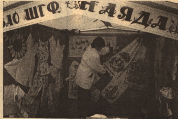
Экспозицию "Наяды" не обходит стороной ни одна женщина

пить продукты, произведенные предприятиями области, непосредственно у производителя. Такая форма торговли взаимовыгодна и для отечественного товаропроизводителя, и для потребителя. Конечно, говорить о дефиците товара нынче не приходится. Однако разрушенная система государственной торговли, переход экономики на рыночные рельсы создали свои проблемы. Многочисленные по-