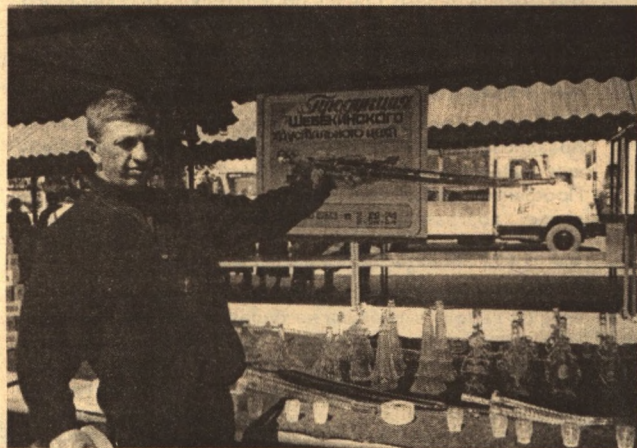
Впервые на Белгородчине освоили производство хрусталя шебекинцы

Первый день работы ярмарки «Салют Победе» совпал со знаменитым событием в жизни Белгородчины - визитом Президента Российской Федерации Владимира Путина. Из-за этого официальную церемонию открытия пришлось перенести на следующий день. Но именно 4 мая выглянуло солнышко, значительно потеплело. Возможно, и этот природный фактор, а также информация по местным каналам радио и телевидения вкупе с «сарафанным телеграфом» привлекли гораздо больше, чем в первый день, посетителей. Практически все, кто пришел на ярмарку, разместившуюся на рынке «Салют», «у подножия» Харьковской горы, возвращался с нее не с пустыми руками. А выбрать было из чего: более двухсот предприятий различ-