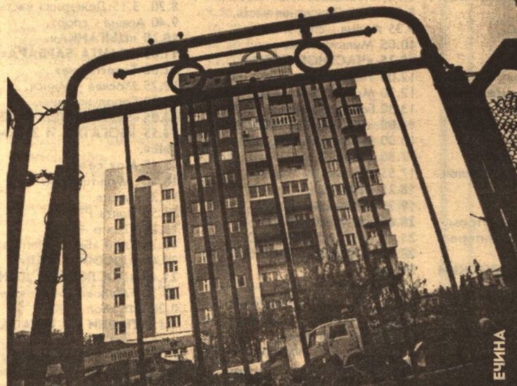
Спальный район Белгорода

Так же далек от мысли, что грядущие поколения на таком же вре-