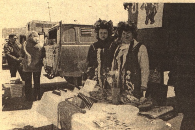
Шебекинские машиностроители предлагают широкий выбор товаров народного потребления.

ных форм собственности выставили товар лицом. Меж прилавков разгуливали с шутками-прибаутками самые настоящие скоморохи из Белгородского районного Дома культуры, призывая народ делать покупки.