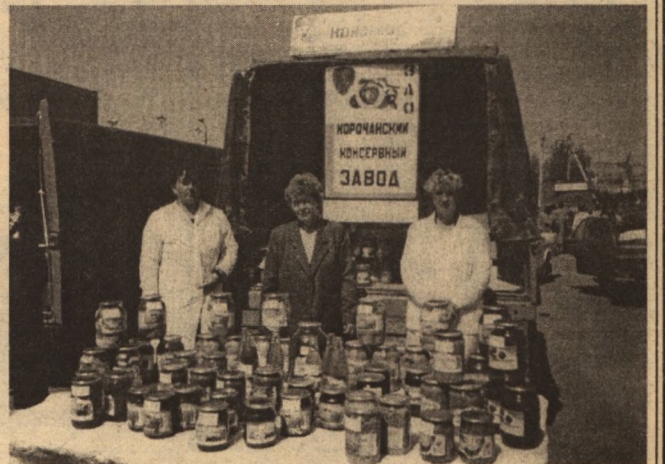
40 наименований плодово-овощной продукции выпускает Корочанский консервный завод

Свою продукцию привезли на ярмарку и производи-