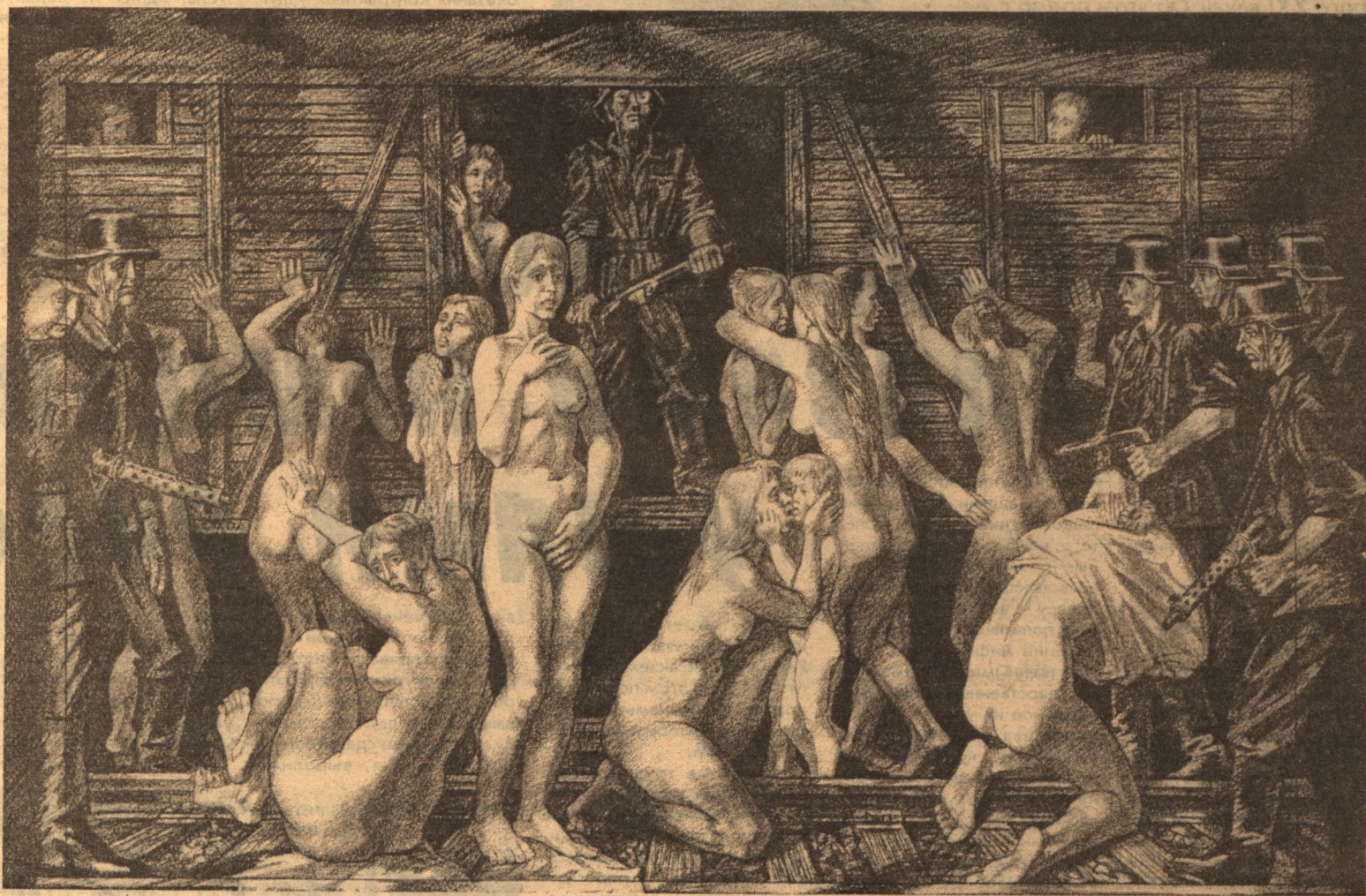
Рисунок Станислава КОСЕНКОВА "В Германию"