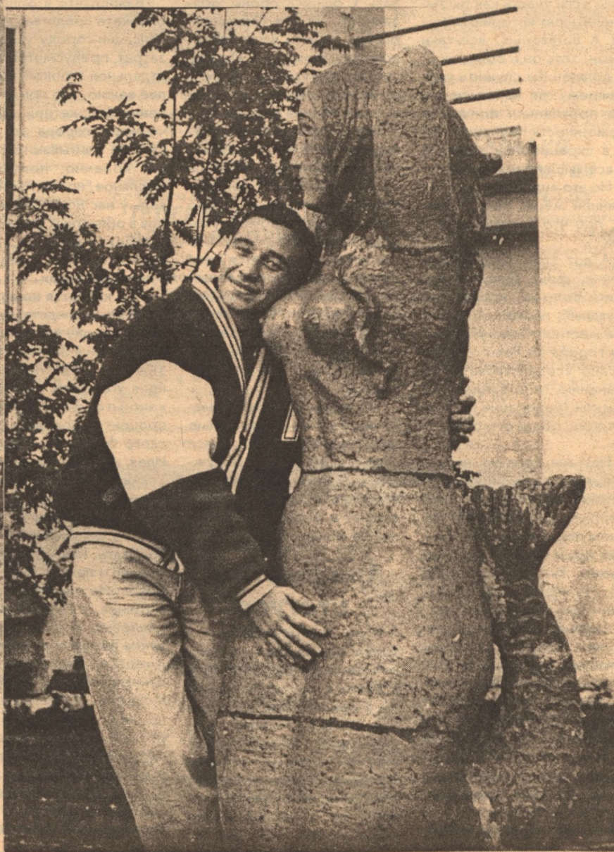
"Дельфин и Русалка"