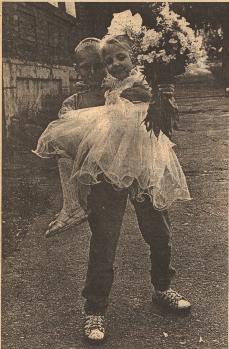
Мальчик и девочка