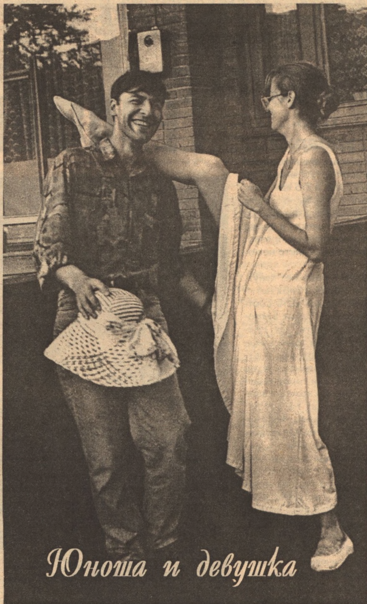
Юноша и девушка