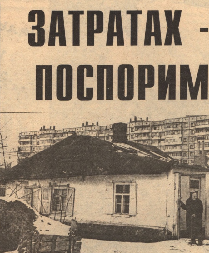
Еще недавно в областном центре было две проблемы: отсутствие статуса и никудышные дороги. Теперь наш город официально признан столицей Белгородчины. Слава тебе, Дума областная второго созыва! Остались дороги...

сти, которые так и норовят нам фонд своими инородными генками подпортить.