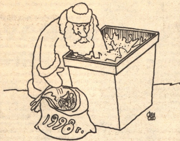
Рис. А. ПАНАСЕНКО