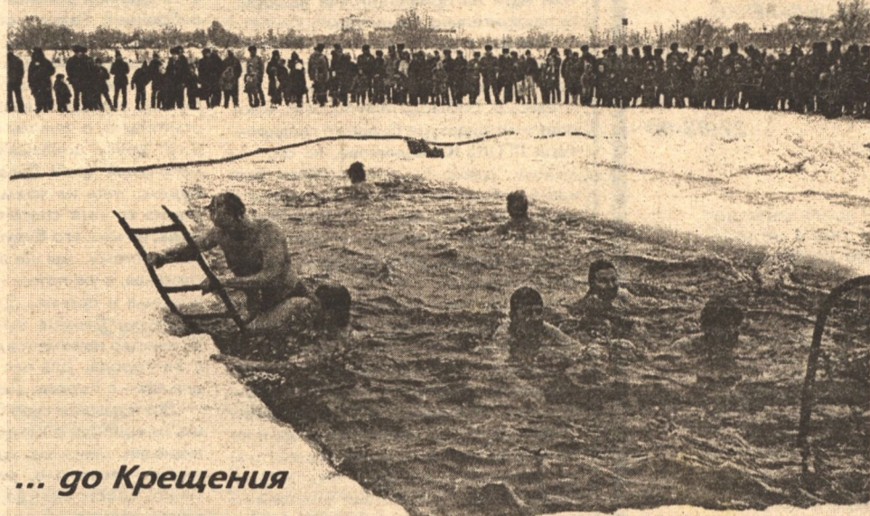
... до Крещения