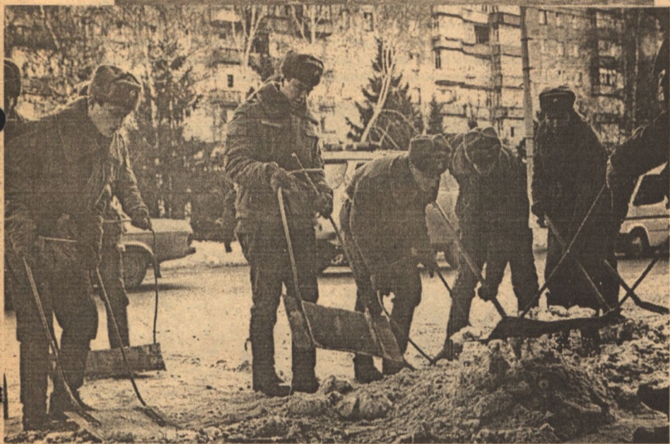
Воины белгородского гарнизона атакуют снежные преграды на дорогах города.