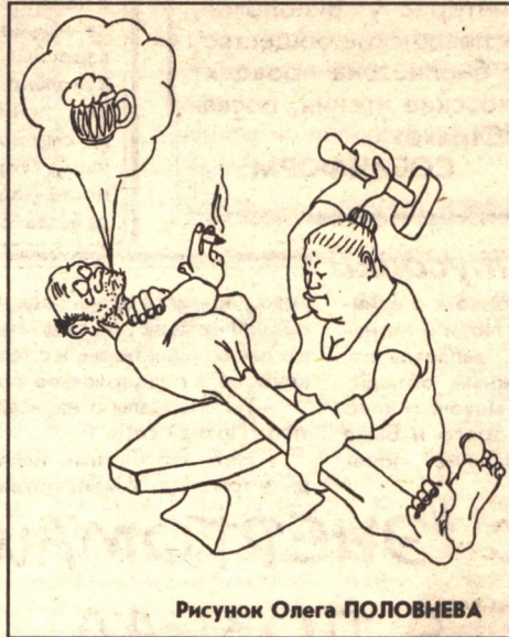
Рисунок Олега ПОЛОВНЕВА