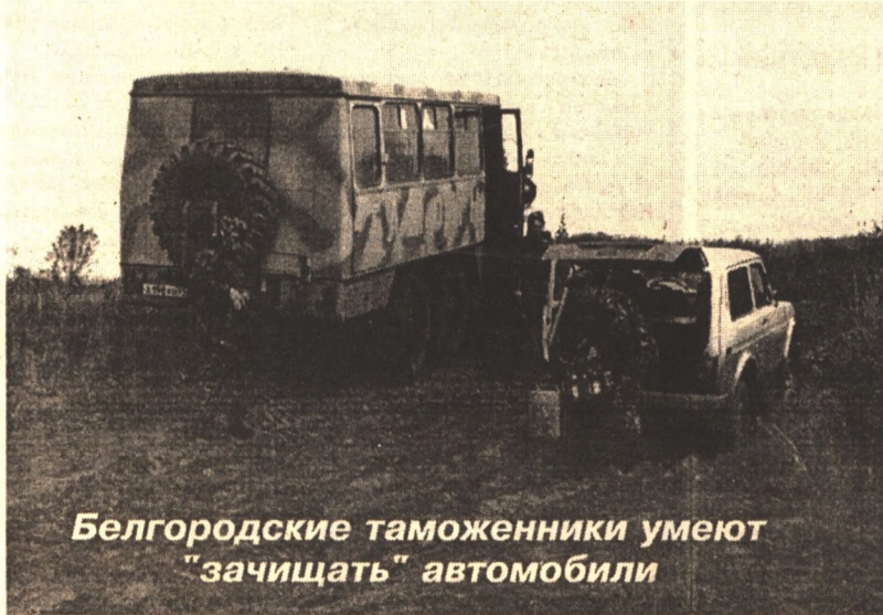
Белгородские таможенники умеют "зачищать" автомобили

Именно поэтому криминальная среда активно изыскивает способы ухода от таможенных платежей, так как именно таможенная "очистка" - единственный способ регулирования