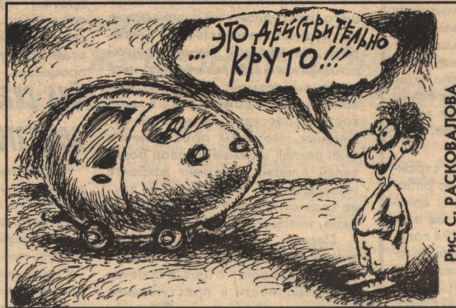
Рис. С. РАСКОВАЛОВА