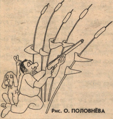
Рис. О. ПОЛОВНЁВА

Читайте наши советы и тогда, возможно, у вас все обойдется. Итак: