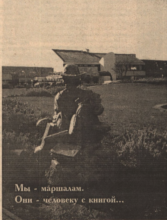
Мы - маршалам. Они - человеку с книгой...