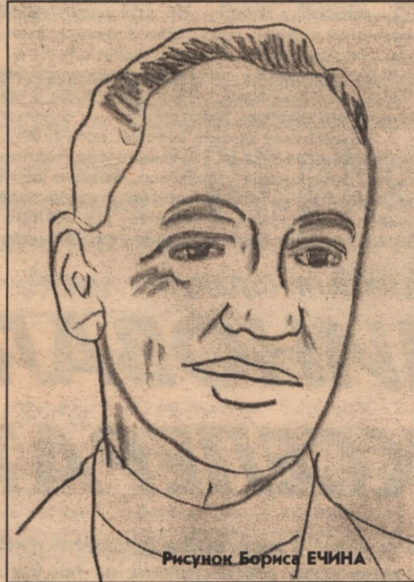
Рисунок Бориса ЕЧИНА

Но как оставить выдуманный мир? Банальный сон уныло скучной пьесы, Придуманной не в наших интересах, Где жизнь - тоска, да кухня, да сортир?..